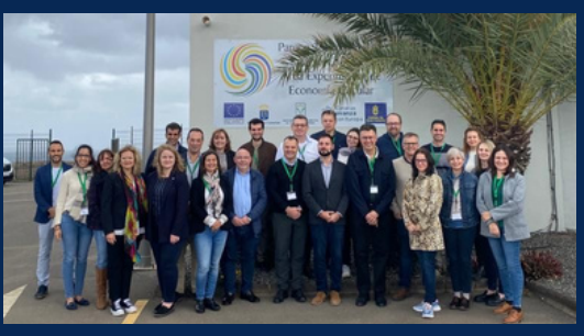
I partner del progetto riuniti presso l'Università di Las Palmas de Gran Canaria

A questo proposito, nel mese di gennaio, si è svolta, presso l' Università di Las Palmas de Gran Canaria , la seconda riunione plenaria di progetto, dove tutti i partner si sono riuniti per monitorare l'andamento delle attività di progetto. Sono state discusse le questioni relative ai singoli Work Package, sono stati presentati i risultati dei sondaggi dei diversi target group individuati, è stata discussa la preparazione del materiale per la formazione sull'economia circolare nei settori produttivi delle materie plastiche, ed infine sono stati discussi i requisiti per la creazione della piattaforma elettronica del progetto e la presentazione della cooperazione tra imprese e istituzioni educative.